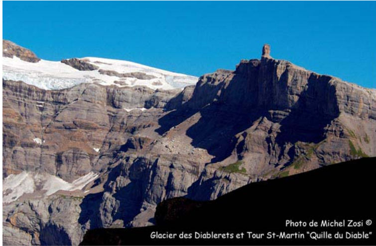
Glacier des Diablerets et Tour St-Martin "Quille du Diable"